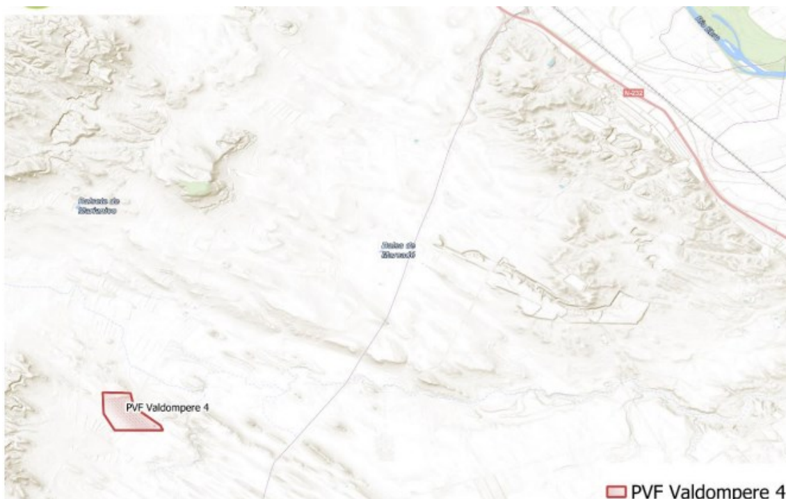
Figura 1 Localización del proyecto

El parque fotovoltaico (Figura 1) se encuentra en las cercanías de la N-232 y junto a la delimitación del término municipal de Quinto, el cual se encuentra a 7,5 km al Este del emplazamiento del proyecto, mientras que el núcleo de población más cercano al parque fotovoltaico es el propio municipio de Fuentes de Ebro, situado a aproximadamente 9 km al Norte del vallado perimetral del parque fotovoltaico objeto de proyecto.