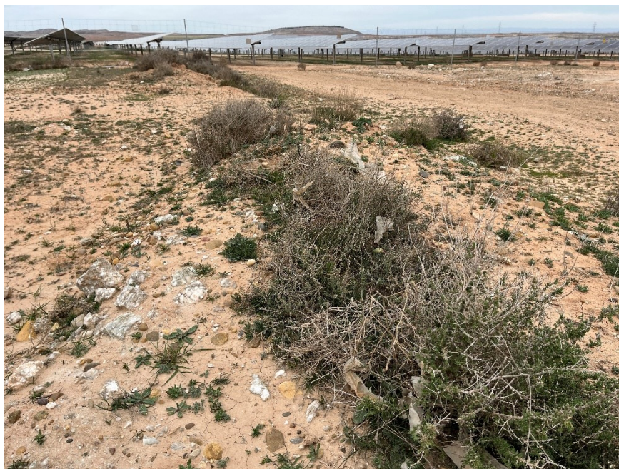
Figura 4 Restos de plásticos en el exterior de la planta

El presente anexo se compone de un número representativo de fotografías del total realizado durante el periodo evaluado, escogidas por su relevancia y/o carácter explicativo para la correcta comprensión del presente informe.