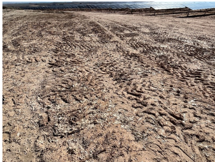
Figura 2 Restos de plásticos

El acopio logístico de materiales para la fase de construcción se ha realizado de manera correcta en las zonas destinadas para esta labor.