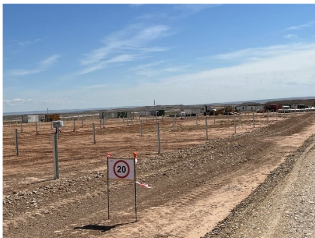
Figura 3 Señalización en obra