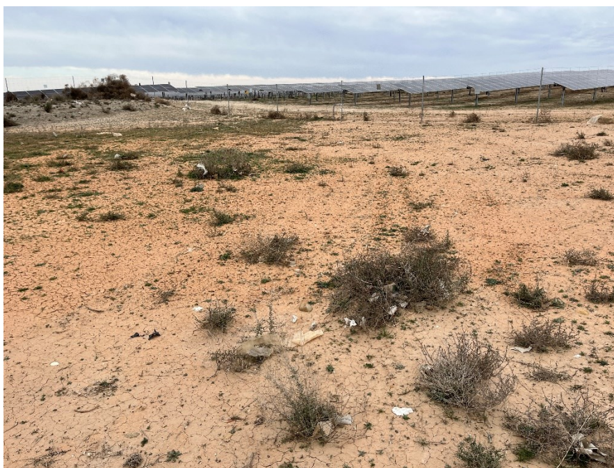
Figura 5 Restos de plásticos en el exterior de la planta