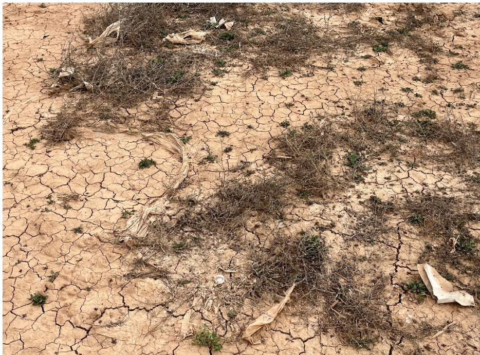
Figura 6 Restos de plásticos